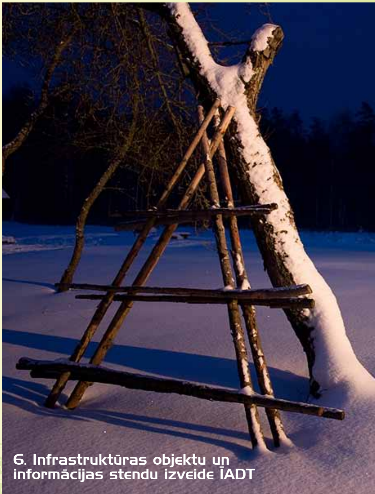
6. Infrastruktūras objektu un informācijas stendu izveide ĪADT

2009.gadā Pārvalde ir veikusi sekojošus izveidotās tūrisma infrastruktūras uzturēšanas darbus: kopā uzturētas takas 146,2km un kāpnes 3340m garumā, kā arī 184 tilti un laipas kopumā 7815 m garumā. Remontētas un atjaunotas 54 skatu vietas ar kopējo platību 22620m 2 , kā arī 123 tūristu atpūtas vietas, 65 tualetes, 435 soli, 13 nojumes un 156 atkritumu urnas. Uzturēti 1353 m dažāda veida drošības barjeras un 12410 m dzīvnieku nožogojuma (tabula Nr.3).