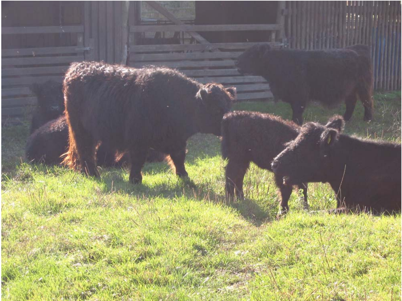
Attēls 6.2. Galloway šķirnes govīs – ideālas pļavu apsaimniekotājas (izturīgas, neliela auguma, perspektīvas bioloģiskai lauksaimniecībai).