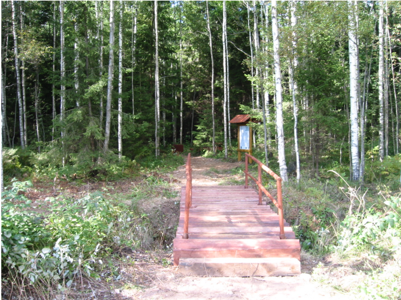
Attēls 3.5. Dabas taka Ellītes purva dabas liegumā.

Dabas aizsardzības pārvalde 2003. gadā atbalstīja dažāda veida ĪADT apsaimniekošanas pasākumus, kopsummā par 20 892 Ls . Tika noslēgti 4 līgumi par apsaimniekošanas plānu sagatavošanu un 18 līgumi par apsaimniekošanas pasākumu veikšanu 15 īpaši aizsargājamās dabas teritorijās, finansējot biotopu atjaunošanu, apsaimniekošanu, tūrisma mazās infrastruktūras attīstību (dabas taku atjaunošana, informatīvo stendu izvietošana, u.c.), kā arī informatīvo materiālu izdošanu, ar mērķi veikt sabiedrības izglītošanu un veidot saudzīgu attieksmi pret vidi. Darbus izpildīja attiecīgo pašvaldību, tūrisma informācijas centru darbinieki, zemes īpašnieki, Latvijas dabas fonds, SIA "ELLE" un dabas parka "Daugavas loki" administrācija.