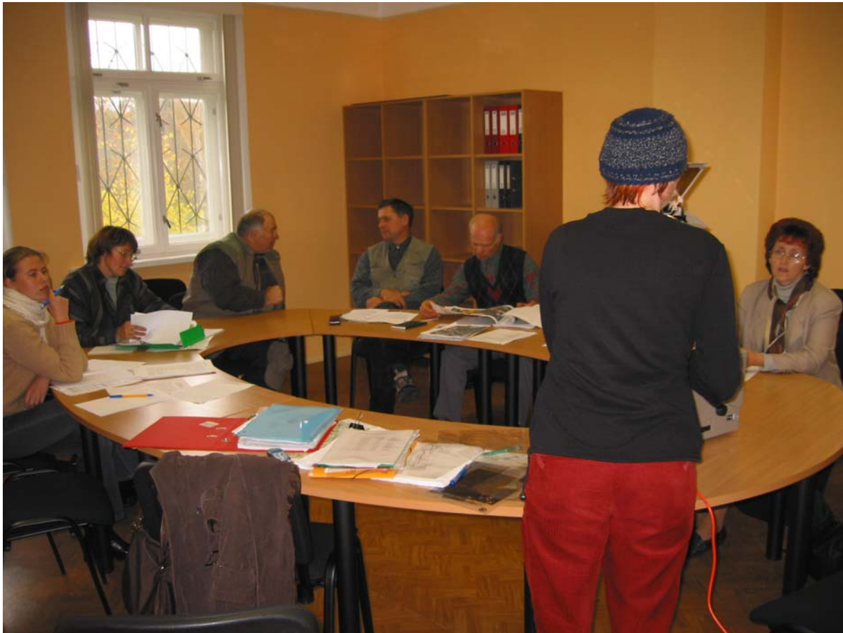
Attēls 3.4. Kornetu - Peļļu dabas lieguma dabas aizsardzības plāna uzraudzības grupas sanāksme.

Šādām īpaši aizsargājamām dabas teritorijām 2003. gadā tika izstrādāti dabas aizsardzības plāni (pie atsevišķām teritorijām darbs turpinās arī 2004. gadā):