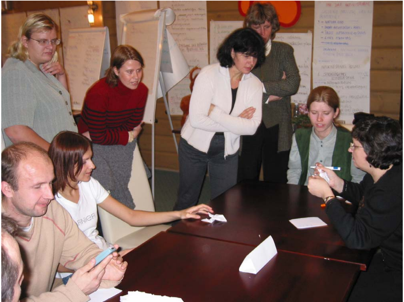
Attēls 6.1. Komandas attīstības treniņš – situācijas analīze