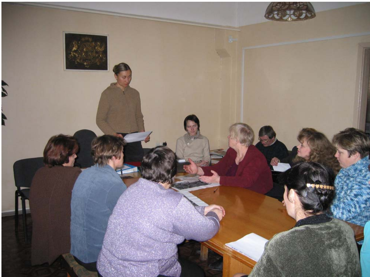
Attēls 3.1. Informatīvā sanāksme Asūnes pagastā par dabas lieguma Asūnes ezeri izveidošanu.

Jūlijā – decembrī robežas tika saskaņotas ar aptuveni 100 pagastiem. Daļa pašvaldību saskaņošanas procesā neizteica vēlmi organizēt sanāksmes, pieņēma lēmumus deputātu padomes sēdēs, pieaicinot RVP vai Pārvaldes pārstāvi. Pārsvārā tās bija teritorijas, kur netika skartas zemes īpašnieku saimnieciskās darbības intereses: teritoriju apsaimniekoja VAS LVM, teritorijas bija nelielas, vai arī tā bija pašu iniciatīva ierosināt ĪADT.