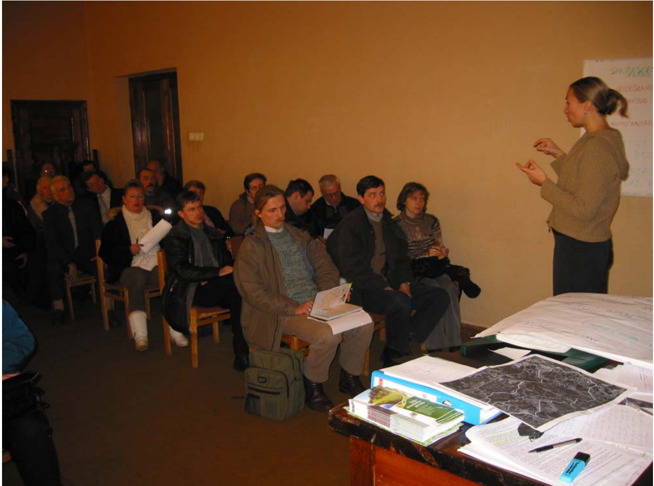
Attēls 3.2. Informatīvā sanāksme Ērgļos par dabas parka Ogres ieleja izveidošanu.

Lielākā daļa pašvaldību lēmuma pieņemšanu balstīja uz zemes īpašnieku nostāju, uzklausot viņu viedokli Dabas aizsardzības pārvaldes, Reģionālo vides pārvalžu un pagastu rīkotajās sanāksmēs, kurās piedalījās arī Valsts meža dienesta darbinieki un citi interesenti.