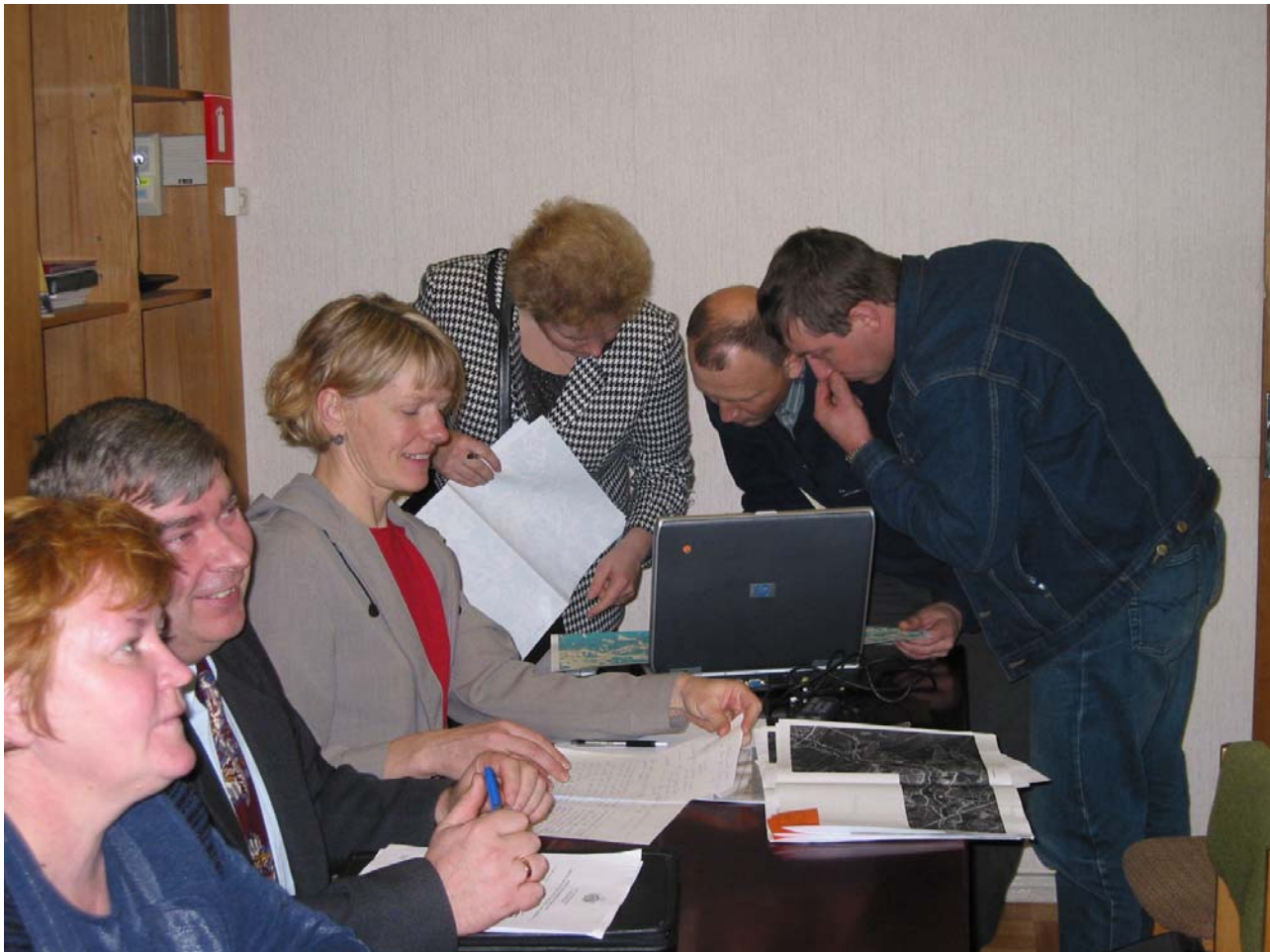
Attēls 3.3. Tikšanās ar Ogres rajona pašvaldību vadītājiem un Vidusdaugavas mežsaimniecības speciālistiem par dabas parka Ogres ieleja izveidošanu.

Atsevišķi robežas tika precizētas ar MPS Kalsnava un Rīgas mežu aģentūru, VAS „Latvijas valsts meži” astoņu reģionālo struktūru pārstāvjiem, parakstot saskaņošanas protokolus.