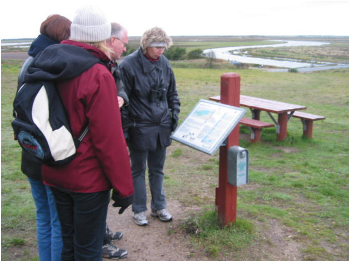
Attēls 6.3. Skjern upes atjaunošanas projekts, informācijas infrastruktūra.