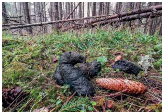
Lāča ekskrementi.

Lāča ekskrementu kaudzītes, to forma, krāsa un konsistence var būt ļoti dažāda – atkarībā no apēstās barības. Lāča gremošanas sistēmā nav augēdājiem raksturīgās aklās zarnas piedēkļa, tādēļ augu barība netiek pilnībā pārstrādāta un izkārnījumos bieži saskatāmas augu barības atliekas.