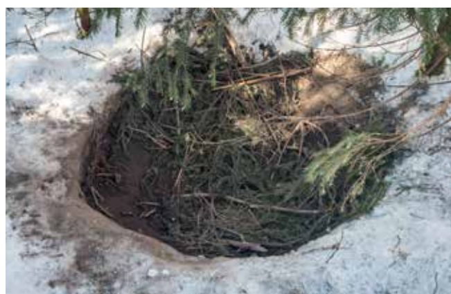
Trīs gadus veca lāču tēviņa mīga, fotografēta 2019. gadā netālu no Vāli ciema, Jervas apriņķī.

Atšķirībā no meža cūkas gulvietas, kas ir iegarena, lāča izraktā un iekārtotā iedobe parasti ir apaļāka.