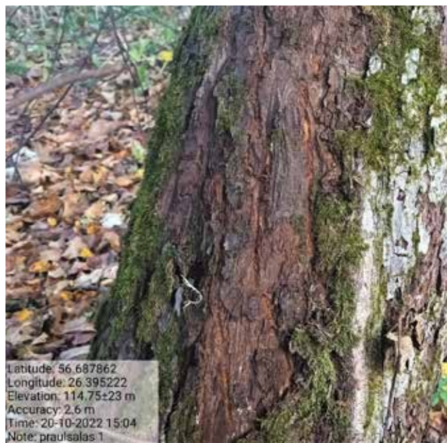
Lāča nagu skrāpējums uz ābeles.

Visbiežāk lāča skrāpējumi vērojami uz priedes vai rudens ābolu ražas laikā, arī uz ābeles stumbra. Priekšķepu un pakalkāju nagu skrāpējumi uz koku stumbriem atrodami pēc teritorijas iezīmēšanas, barības ieguves vai pēc lāča kāpšanas kokā.