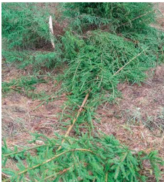
Lāča nolauztas eglītes.

Nolaužot eglītes, lācis iezīmē teritoriju un signalizē, ka tuvākajā apkārtnē grasās doties ziemas guljā.