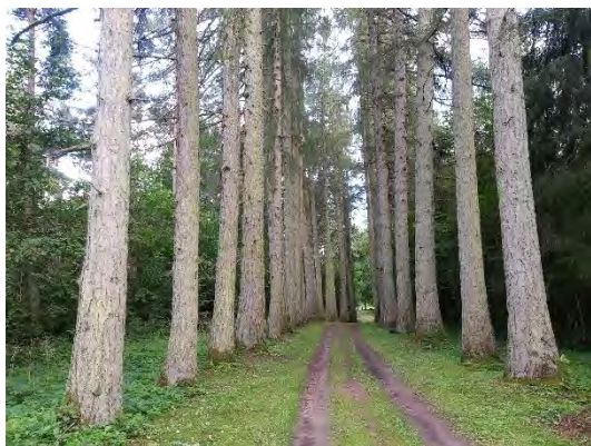
1.attēls. Kartavkalna aleja.