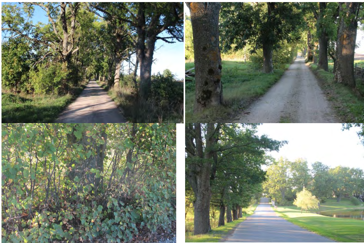
2.attēls. Vispārīgs Rūmenes alejas raksturojums. Aleja ir tipiska prioritāri aizsargājamā lapkoku praulgrauža Osmoderma barnabita dzīvotne. Apakšā, labajā pusē – skats uz netālu esošo Rūmenes muižu ar parku, kas arī ir potenciāla lapkoku praulgrauža dzīvotne.

Vispārīgs vizuāls priekšstats par Aleju iegūstams, iepazīstoties ar 2.attēlu. Aleja ir 700m gara. Aleja novietota uz vairāk vai mazāk līdzena reljefa, gar grantētu lauku ceļu. Ceļš ir ļoti šaurs, koki aug ļoti tuvu ceļa brauktuvei, apmēram 0,5m attālumā, daudziem ir nobrāzta stumbra virsma. Alejā aug vidēju dimensiju un vecuma oši, piemīstojumā – liepas. Alejai ir tipiska "tuneļveida" struktūra, lai gan starp kokiem vietām ir lielāki attālumi. Kokiem līdzās daudzviet ir stumbrus noēnojoši krūmi (ceļa rietumu malā). Ošiem ir ļoti dažāda vitalitāte. Pieguļošajā teritorijā ir lauksaimniecības zemes, Alejas dienvidu galā – ēkas, apbūve. Netālu atrodas Rūmenes muiža ar parku, dobumaini koki pieejami arī citur Rūmenes ielu malās.