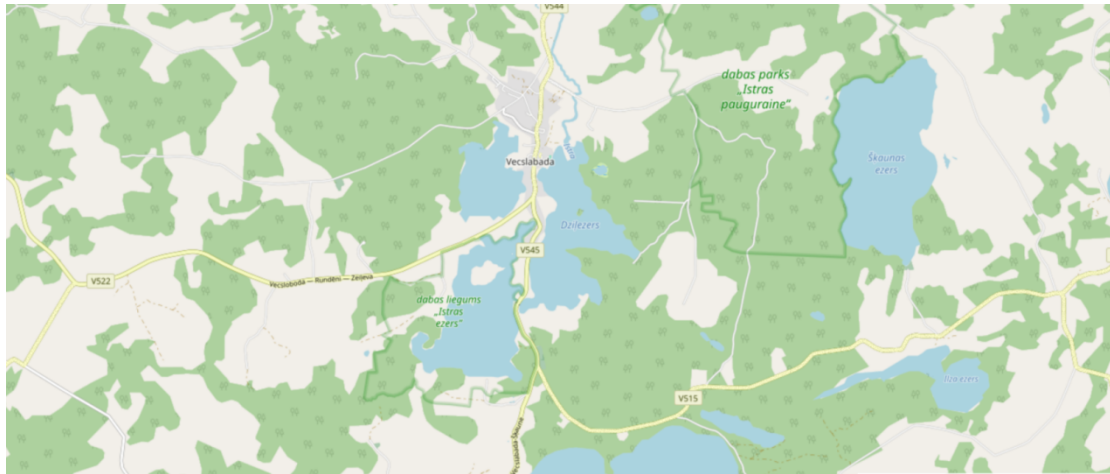
1.attēls. Jaunveidojamā Istras dabas parka novietojums 5

Piekļuves tīkla telpiskā analīze (saistīta ar antropogēno slodzi, apmeklētības intensitāti, transporta trokšņa ietekmi) nenozīmīga: