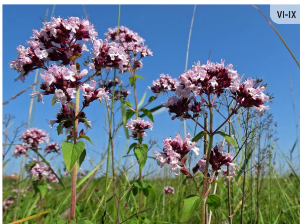
Origanum vulgare PARASTĀ RAUDENE