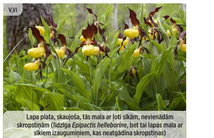
● Cypripedium calceolus DZELTENĀ DZEGUŽKURPĪTE