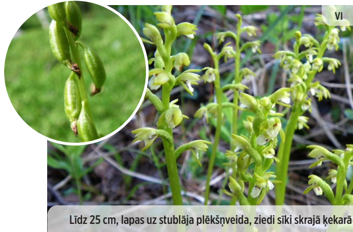
● Corallorhiza trifida TREJDAIVU KORALĶŠAKNE