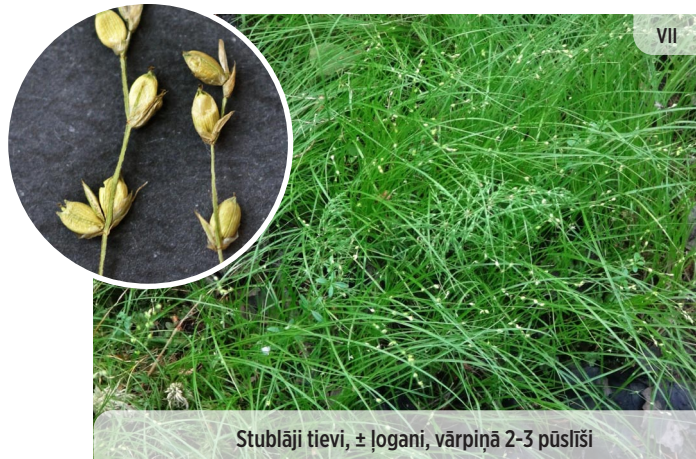
● Carex disperma DIVSĒKLU GRĪSLIS