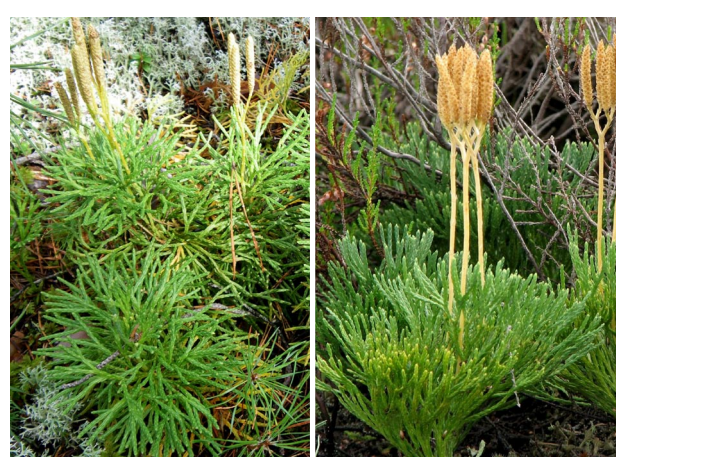
● Diphasium complanatum PARASTAIS PLAKANSTAIPEKNIS