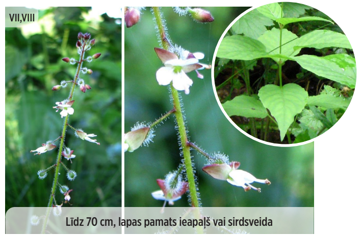
● Circaea lutetiana LIELĀ RAGANZĀLĪTE