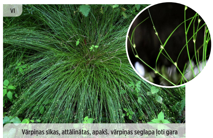
● Carex remota ATTĀLVĀRPU GRĪSLIS