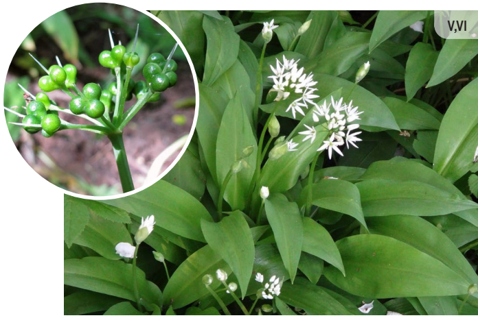
● Allium ursinum LAKSIS