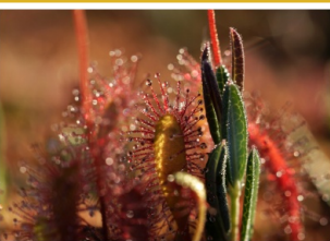
Rasene un andromeda Andrupenes purvā