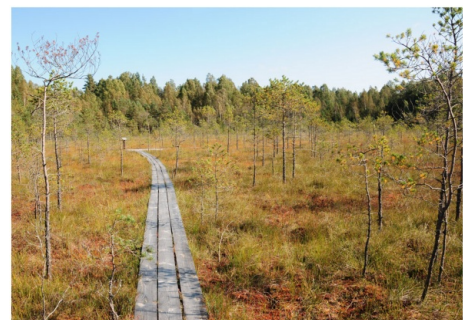
Andrupenes purva laipa

Citus aktīvā tūrisma maršrūtus meklējiet www.celotajs.lv !