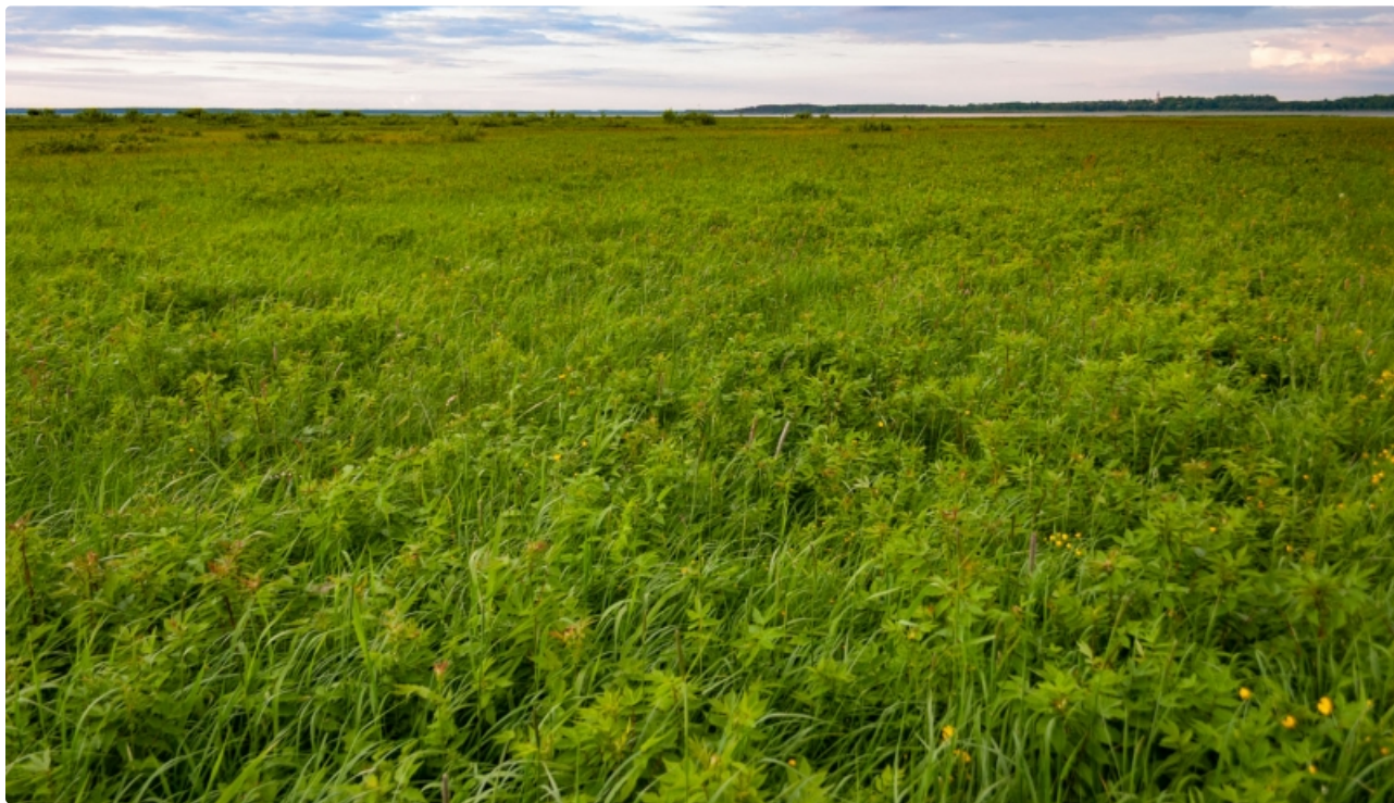
Dabas liegums Burtnieku ezera pļavas. Briedes grīva.

Nozīmīgas platības aizņem aizsargājami biotopi: mēreni mitras pļavas, eitrofas augsto lakstaugu audzes un upju palieņu pļava