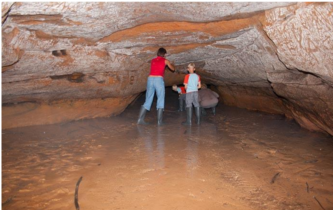
Vējiņu alas.

Teritorijā ir divas lielākas un viena maza ala, kā arī nelielas nišas. Upes alas ieeja atrodas upes līmenī, Braslas gultnes malā. Tā ir 42 m gara ala ar 5 m plašu, likumotu galveno eju un diviem lielākiem paplašinājumiem. Ezerālas ieeja atrodas vienā no kritenēm, un tās lielāko daļu aizņem viens no nedaudziem un lielākais pazemes ezers Latvijas alās - 45 kvadrātmetru platībā.