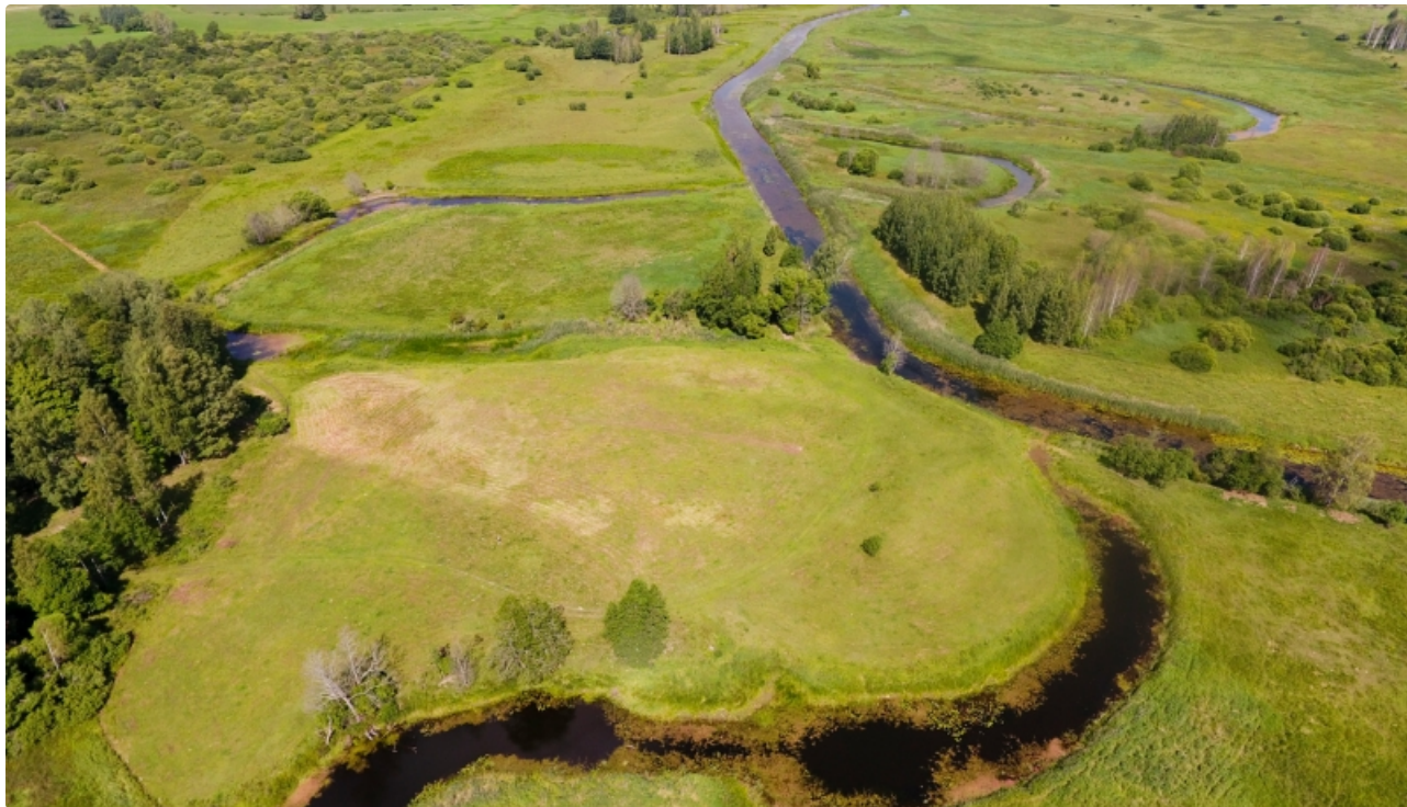
Dabas liegums Dubnas paliene.

Teritorija izveidota, lai saglabātu izcilas sugām bagātas mēreni mitras pļavas un upju paliņu pļavas (ES Biotopu direktīvas biotopi), kas aizņem lielas platības. Teritorijā sastopamas 3 īpaši aizsargājamas augu sugas: jumstiņu gladiolu, rūgto drudzenīti un stāvlapu dzegužpirkstīti. Augsts ligzdojošo griežu blīvums, ligzdo arī ormanītis.