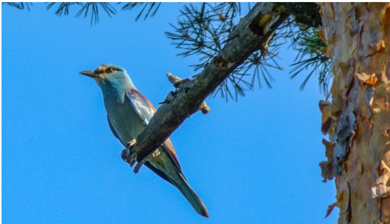
Dabas liegums GARKALNES MEŽI. Zaļā vārna.

Lielākā zaļās vārnas ligzdošanas vieta Latvijā (ap 20 ligzdojošu pāru jeb 80-90 % no visas nacionālās populācijas). Viena no pēdējām zaļās dzilnas ligzdošanas vietām Latvijā. Daudz citu retu putnu sugu.