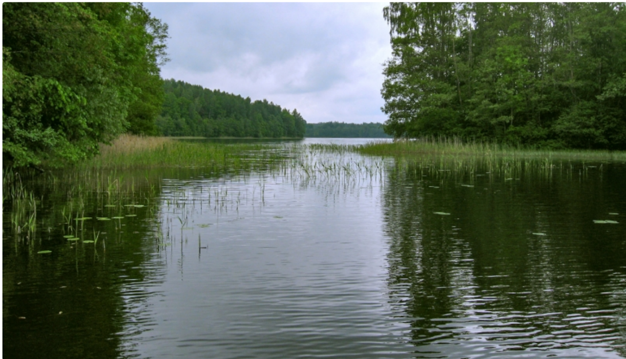
Cārmaņa ezers.

Dabīgs nepiesārņots eitrofs ezers ar Latvijā īpaši aizsargājamiem biotopiem (akmeņaina grunts ezeros, smilšaina grunts ezeros) un īpaši aizsargājamu sugu - mieturu hidrillu. Agrāk ezerā konstatētas dortmana lobēlija un gludsporu ezerene. Ezers ļoti ainavisks - līčains, ar mežainiem krastiem. Nozīmīga vieta ES Biotopu direktīvas 1.pielikuma biotopa - dabīgi eitrofi ezeri ar iegrimušo ūdensaugu un peldaugu augāju - saglabāšanā.