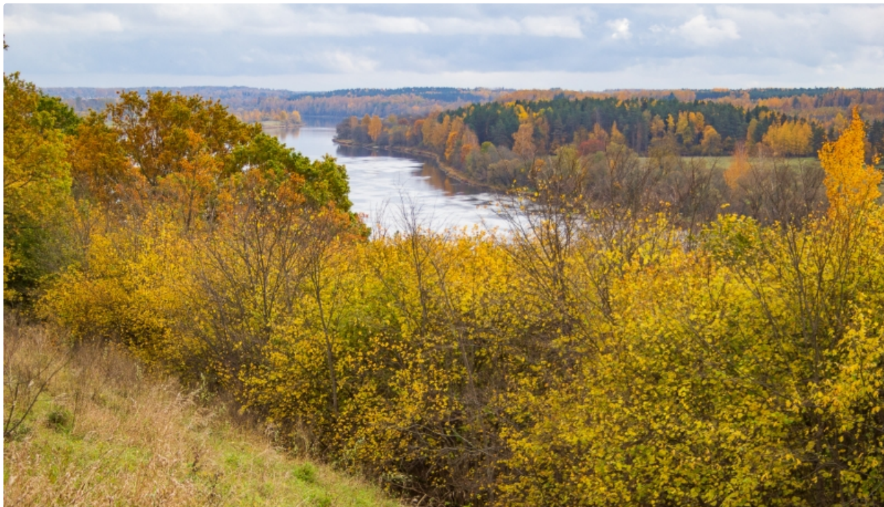
Dabas parks DAUGAVAS IELEJA. Daugava pie Skrīveriem.

Dabas parks izveidots, lai aizsargātu Daugavas senlejas raksturīgāko posmu, kas palicis nepārveidots, būvējot Pļaviņu HES. Galvenā vērtība senlejas pamatkrasta stāvajai nogāzei līdz Dīvajai ietekai, kur nogāzes klāj vērtīgi platlapju nogāžu un gravu meži. Teritorijā daudz dabisku, botāniski vērtīgu sausu pļavu kaļķainās augsnēs un mēreni mitru pļavu, kurās sastopamas retas un aizsargājamas augu sugas. Konstatētas arī kaļķainas smiltāju pļavas, eitrofas augsto lakstaugu audzes. Tuvāk Aizkrauklei arī dolomītu atsegumi, avotu izplūdes vietas krastā. Izcila retu sīkspārņu barošanās vieta.