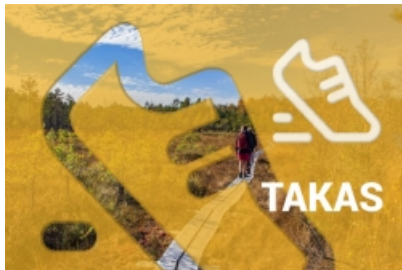
Takas (līdz 10 km)