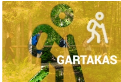
Gartakas (virs 10 km)