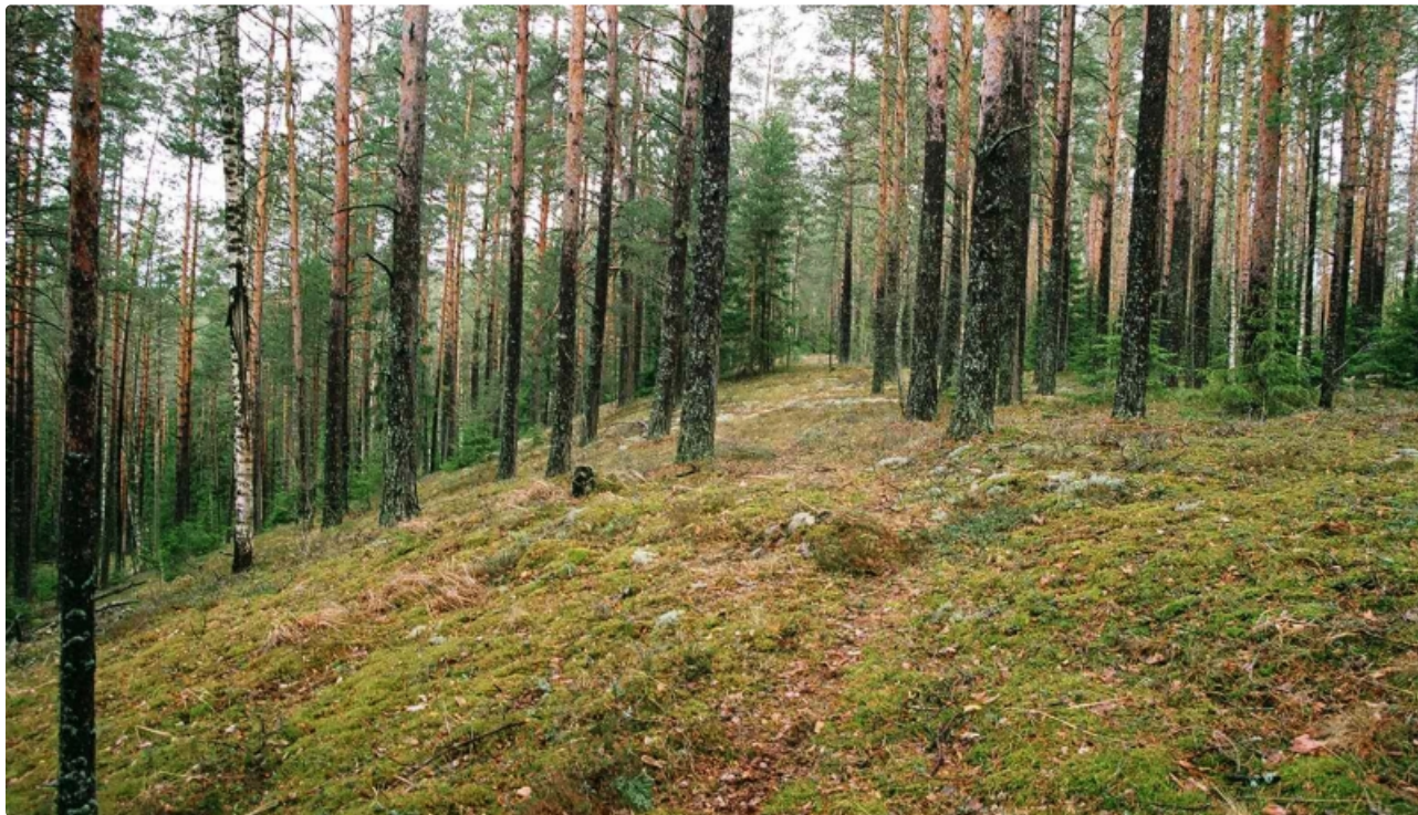
Dabas parks DRIKSNAS SILS.

Teritorija izveidota, lai saglabātu 6 ES Biotopu direktīvas 1.pielikuma biotopus, 2 Latvijā aizsargājamus biotopus, 3 Eiropā aizsargājamas augu sugu atradnes un 10 Latvijā retas augu sugas, kas reprezentē Austrumlatvijas sauso priežu mežu floru. Teritorija ir viena no nedaudzajām vietām valstī, kur sastop sausieņu priežu mežus, kas izveidojušies uz osiem vai osveida vaļņiem. Te sastopama šim biotopam raksturīga augu suga - meža silpurene, kas aug kopā ar citām gaismas prasīgām mežu sugām un veido īpašas, osu mežiem raksturīgas augu sabiedrības ar garkāta ģipseni, zāļlapu smiltenīti, Ruiša pūķgalvi, šaurlapu lakaci. Teritorijā ir bagātīga augu sugas plavas linlapes atradne, kas ir viena no Latvijā zināmajām 5 atradnēm.