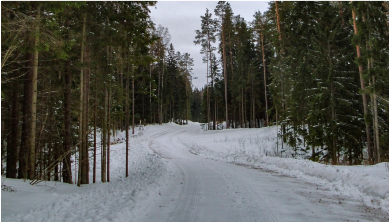
Dabas parks ISTRAS PAUGURAINĒ.

Unikāls vēsturiski ģeogrāfisks komplekss, ko veido grēdu, morēnu pauguru un masīvu reljefs. Teritorijas mežainajā daļā morēnu pauguri un to nogāzes klātas ar sausiem priežu, egļu un jauktajiem mežiem, bet ieplakās sastopami melnalkšņu staignāji un pārejas purvi, kas ir Eiropā aizsargājami biotopi.