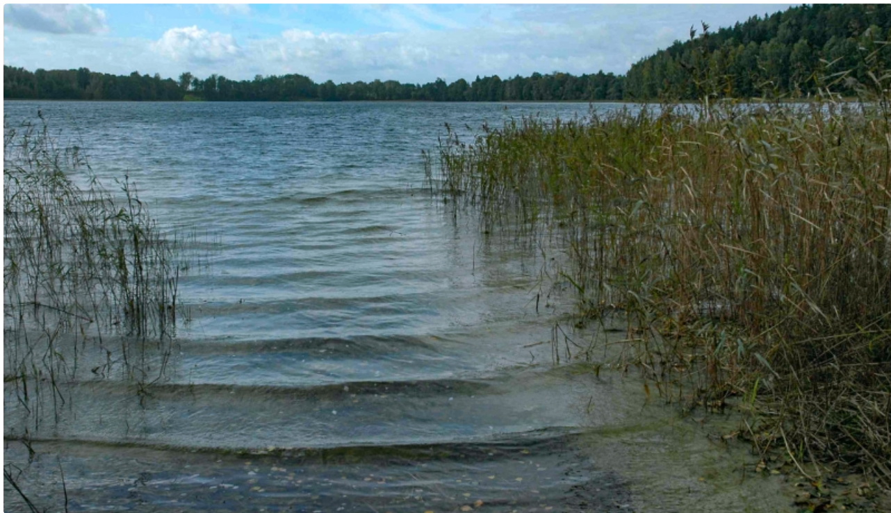
Dabas parks Laukezers.

Aizsargājamā teritorija izveidota, lai saglabātu vismaz 9 Latvijas un Eiropas nozīmes aizsargājamus biotopus un vismaz 12 aizsargājamās augu sugas. Pļavas linlapes viena no 5 atradnēm Latvijā, dižās aslapes - viena no trim atradnēm Austrumlatvijā. Zāļu purva sliekšņā pie Baltiņa ezera aug arī ES Biotopu direktīvas sūnu suga - spīdīgā āķīte. Ļoti vērtīgas priežu mežu sabiedrības sastopamas vaļņa dienvidu nogāzē uz ziemeļiem no Laukezera. Vaļņa augšdaļā sastopama pļavas linlape, bet dienvidu nogāzē - priežu meži ar asinsārto gandreni un meža silpureni. Laukezera litorālē starp niedrēm izklaidus sastop gludsporu ezereni. Ildzenieku ezera dienvidrietumu daļā izveidojies neliels pārejas purvs, kurā sastopami atsevišķi Lēzeļa lipares eksemplāri.