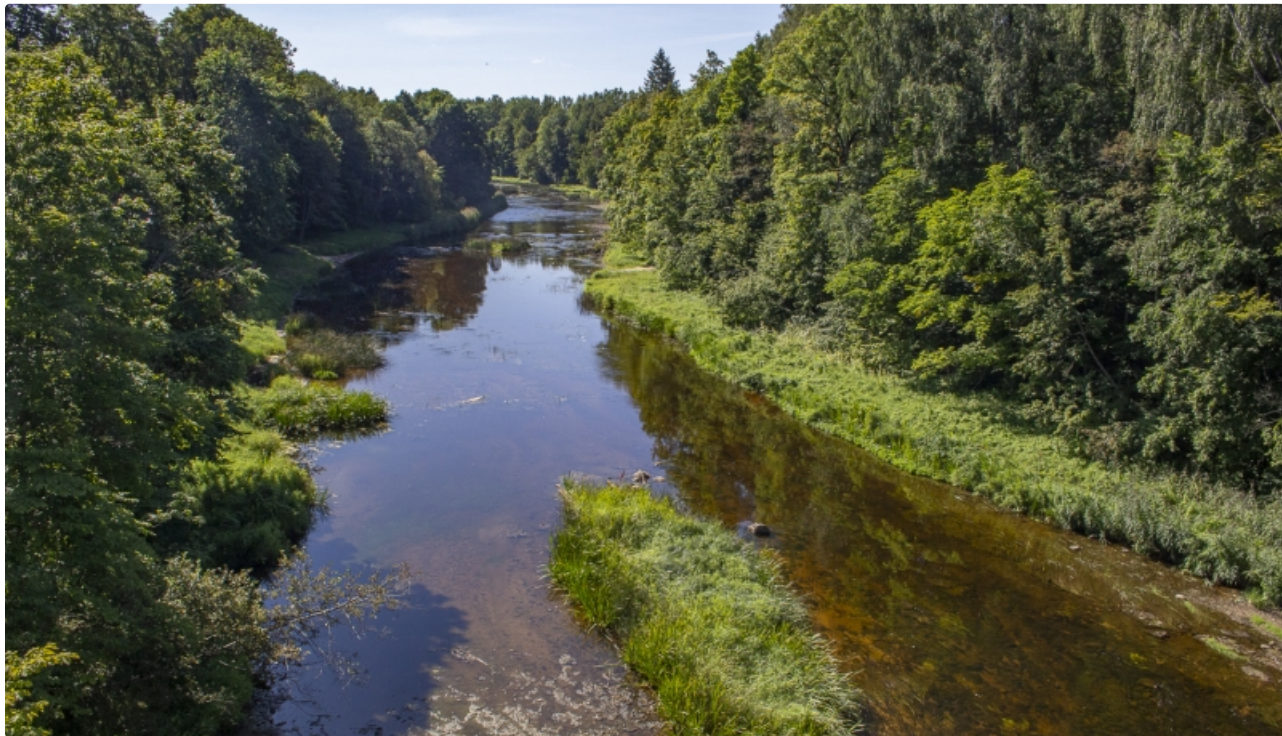
Dabas parks Ogres ieleja.

Ogres ieleja kopumā ir starp bioloģiskās daudzveidības saglabāšanai nozīmīgākajām neregulētu upju ielejām Latvijā biotopu dažādības un savdabības dēļ. Te konstatēti 11 ES Biotopu direktīvas 1.pielikuma biotopi, no kuriem 5 ir prioritāri (nogāžu un gravu meži, parkveida pļavas, sugām bagātas atmatu pļavas, sugām bagātas vilkakūlas pļavas, pārmitri platlapju meži), kā arī vienlaikus 15 Latvijā īpaši aizsargājami biotopi. Viena no nedaudzajām vietām, kur sastopami Latvijā ļoti reti biotopi – parkveida pļavas un jaukti ozolu, gobu, ošu meži upju krastos, upju straujtecēs. Sastopamas vairākas tieši Ogres ielejai raksturīgas retas augu sugas (augstais gaiļpiesis, daudzgadīgā mēnesene), kā arī daudzas Latvijā retas īpaši aizsargājamas augu sugas. Konstatētas vairākas Eiropas direktīvas pielikumos iekļautās augu un dzīvnieku sugas.