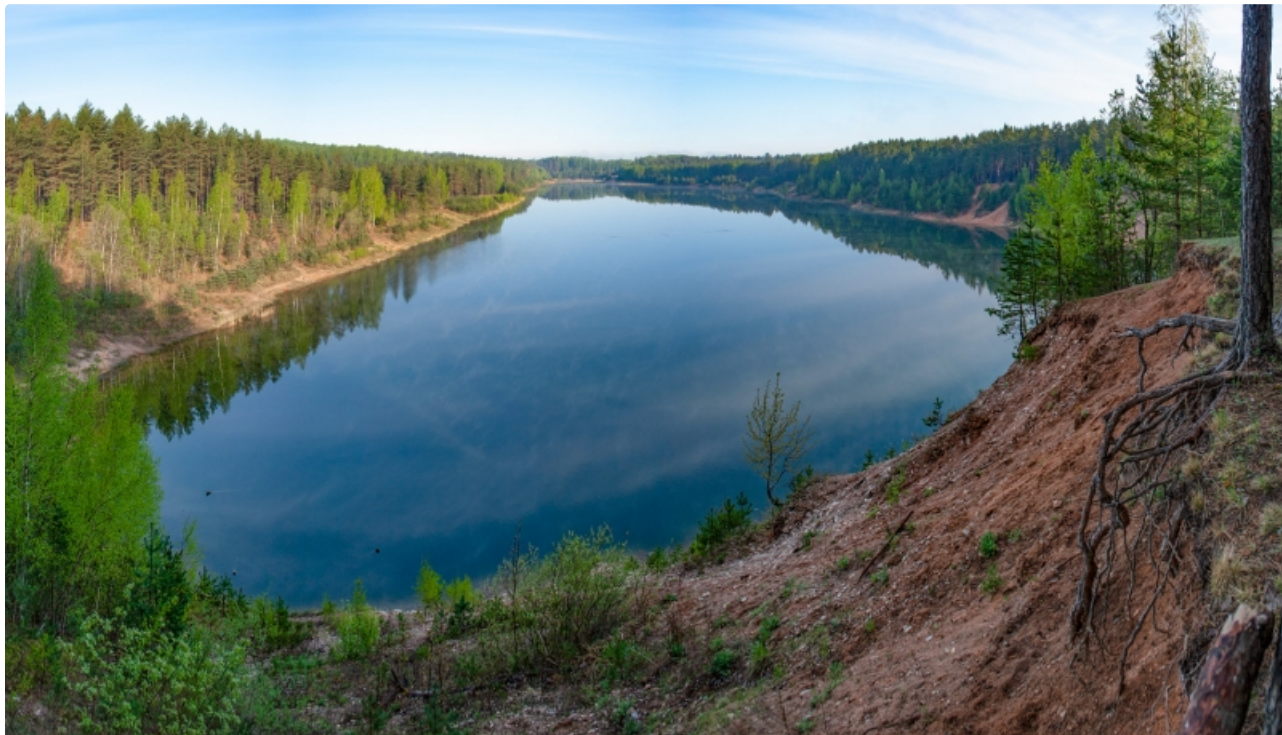
Dabas parks Ogres Zilie kalni.

Teritorijas lielāko daļu aizņem Latvijā ļoti rets Biotopu Direktīvas I pielikuma biotops - skujkoku meži uz osiem. Sastopamas 6 aizsargājamas augu sugas, kas raksturīgas mežiem uz osiem vai osveida vaļņiem - meža silpurene, smiltāju esparsete, šaurlapu lakacis, Ruiša pūķgalve, pundurbērzs, pļavas silpurene.