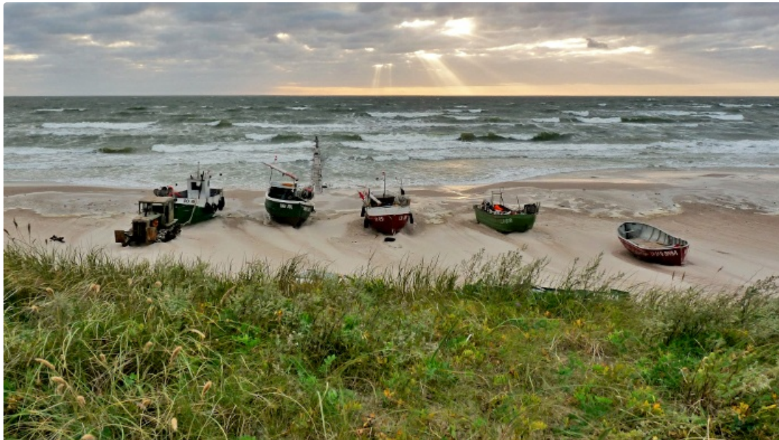
Dabas parks PAPE. Jūrmalciema valgums.

Teritorija izveidota, lai aizsargātu ligzdojošos un caurceļojošos putnus. Papes ezers ir lagūnas tipa sekls ezers - nozīmīga ES Biotopu direktīvas biotopa - mezotrofas ūdenstilpes ar bentisku mieturaļģu augāju - aizsardzības vieta. Bez tam teritorijā sastopami arī tādi aizsargājami biotopi kā pelēkās kāpas ar zemu lakstaugu veģetāciju, kaļķaini zāļu purvi ar dižo aslapi, sugām bagātas vilkakūlas pļavas smilšainās augsnēs, molīnijas pļavas uz kaļķainām vai mālainām augsnēm, jūras piekrastes smilts sēkļi, embrionālās kāpas, neskarti augstie purvi, pārejas purvi un sliksņas, boreālie meži.