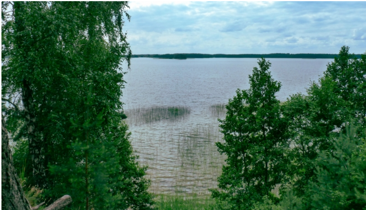
Dabas parks Silene.

Izcila teritorija dažādu mežu tipu (īpaši purvaino) un eitrofu ezeru aizsardzībai. Ezeri ir piemērota barošanās vieta sikspārņiem. Konstatētas arī 2 lielas sikspārņu kolonijas. Īpaši daudz retu un aizsargājamu augu un dzīvnieku sugu.