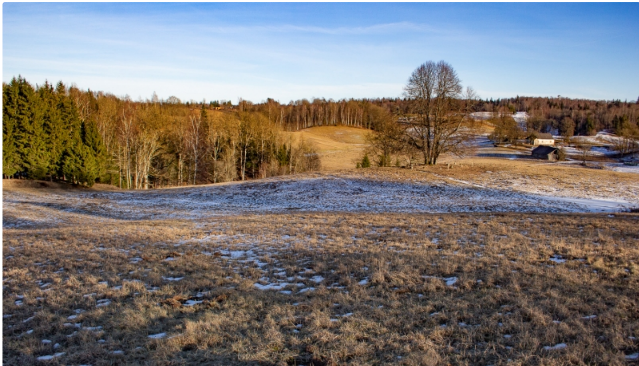
Dabas parks Talsu pauguraine. Skats ceļa posmā Mundīgas-Kampari.

Teritorija izveidota, lai aizsargātu vienu no Ziemeļkurzemes dabas apstākļu ziņā daudzveidīgākajiem apvidiem ar izteikti paugurainu reljefu un vairākiem nelieliem, bet dziļiem ezeriem. Ainaviski izcila teritorija. Konstatēti 6 ES Biotopu direktīvas biotopi. Daudz Latvijā retu un aizsargājamu augu un dzīvnieku sugu. Ezeri un to apkārtnē ir piemēroti biotopi sikspārņiem.