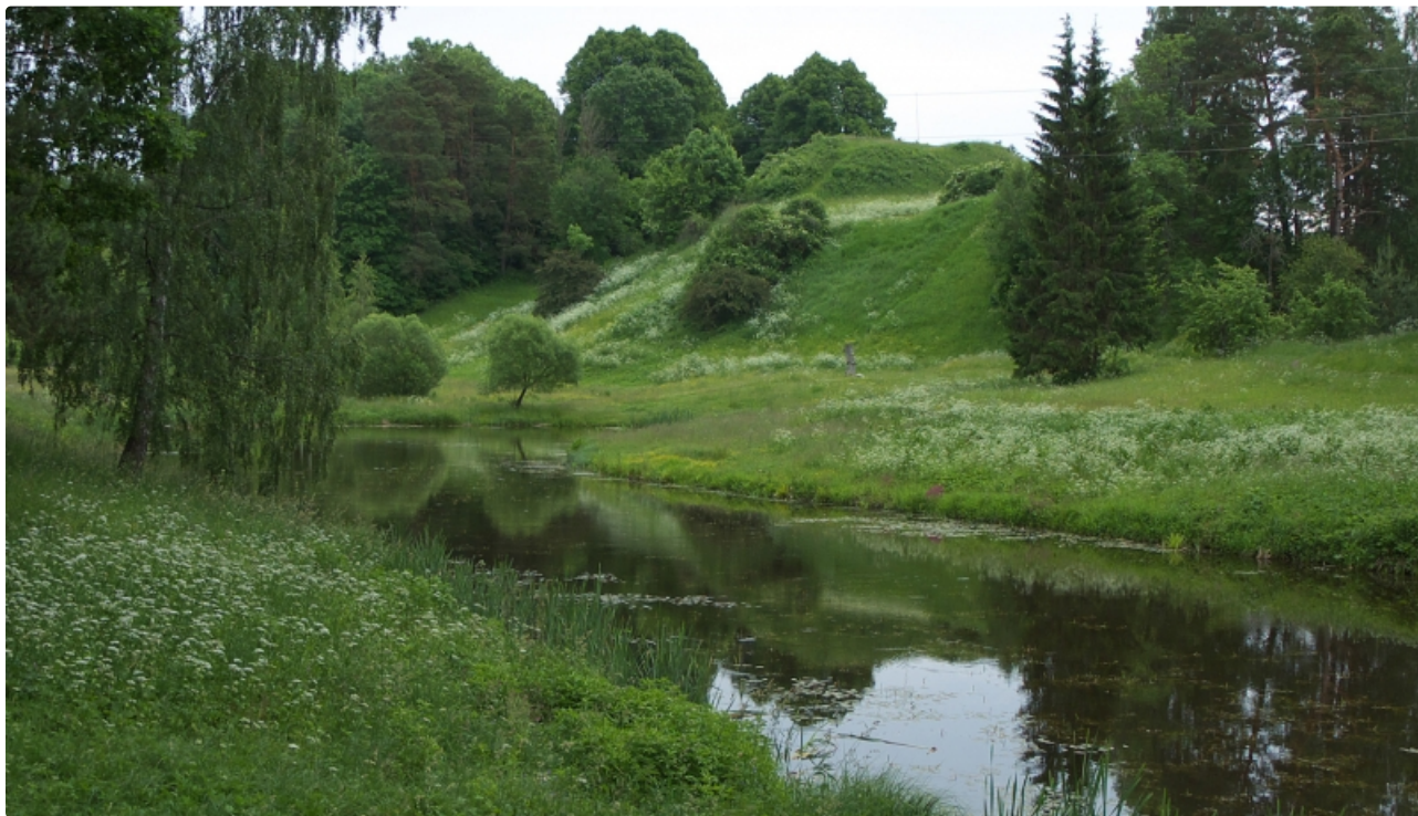
Dabas parks Tērvete. Tērvetes pilskalns.

Lielāko teritorijas daļu aizņem Latvijā reti sastopams priežu meža tips - dižsils. Viena no divām cepurainās neotiantes atradnēm Latvijā. Daudzu retu un aizsargājamu, arī ES Biotopu direktīvas augu sugu atradnes. Liela biotopu daudzveidība. Ainaviski izcils objekts. Teritorijā ietilpst - Tērvetes pilskalns, Svētkalna pilskalns, Klosterkalna pilskalns. Ainaviski vērtīgi Tērvetes un Skujaines krasti.