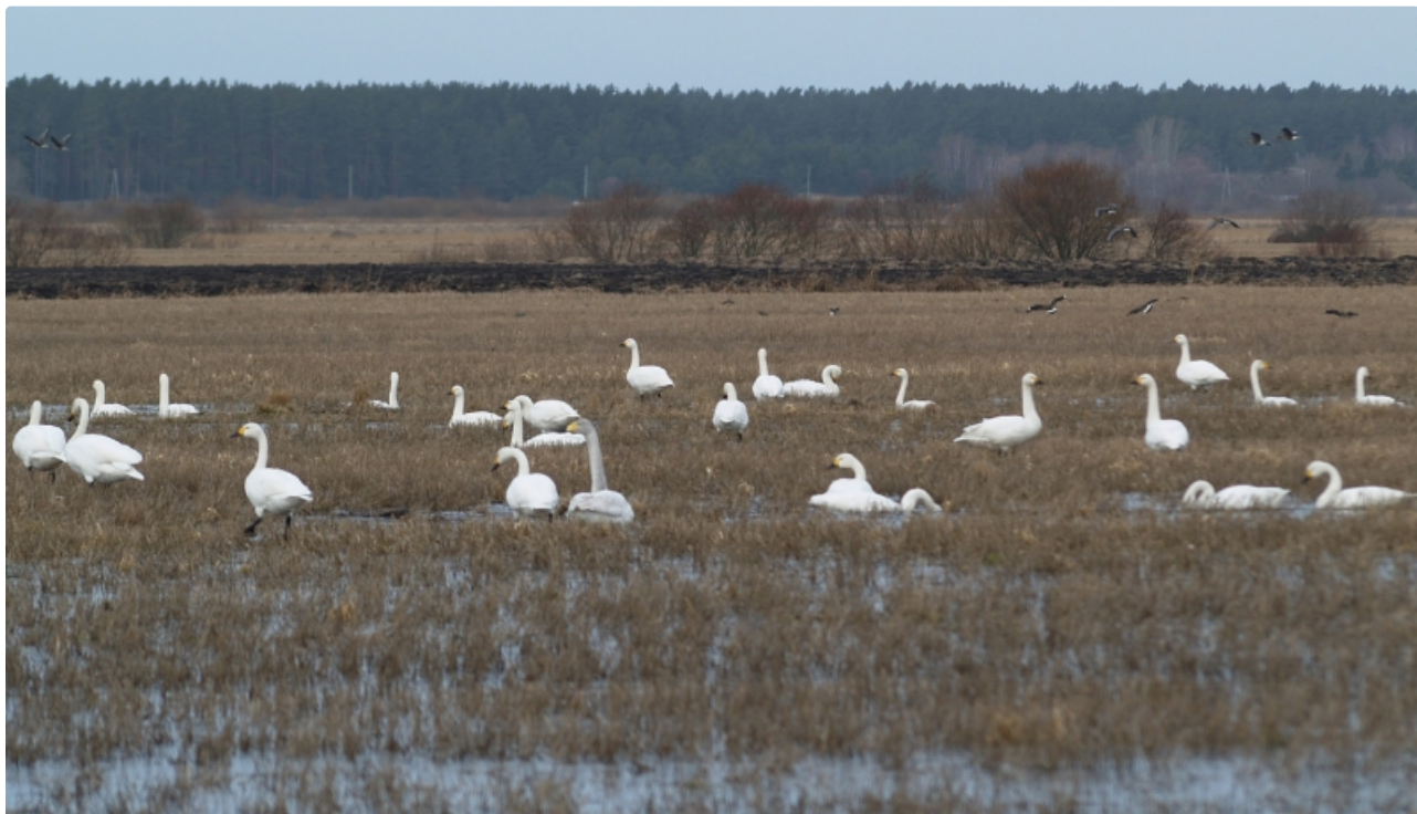
Dabas parks Užavas lejtece.

Putniem nozīmīgā vieta. Svarīga ligzdošanas vieta griezei. Migrācijas laikā, īpaši pavasaros, polderu laukos un uzplūdumos lielā skaitā pulcējas caurceļojošie ūdensputni - zosis, ziemeļu un mazie gulbji, pīles un bridējputni; rudenos dzērves un bridējputni.