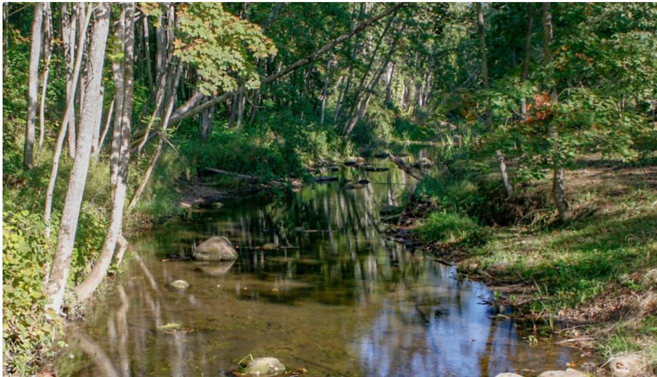
Dabas parks Vilce.

Teritorijā konstatēti 5 ES Biotopu direktīvas biotopi, no kuriem galvenā vērtība ir nogāžu un gravu mežiem, kā arī upju straujtecēm. Teritorija ar augstu ainavisko vērtību, tiek izmantota un ir piemērota rekreācijai. Vilces un Rukūzes upju krasta nogāzēs sastopami nogāžu un gravu meži, kuros īpaši bagātīgi pārstāvēta villainā gundega, kas ir tieši Zemgalei raksturīga, citur Latvijā reta augu suga, līdzīga rakstura suga ir arī pūkainā asinszāle. Īpaši dziļā Rukūzes upītes ielejā konstatēts visvairāk straujteču. Rukūzes kreisajā krastā pirms ietekas Vīlcē sastopami arī nelieli smilšakmens atsegumi.