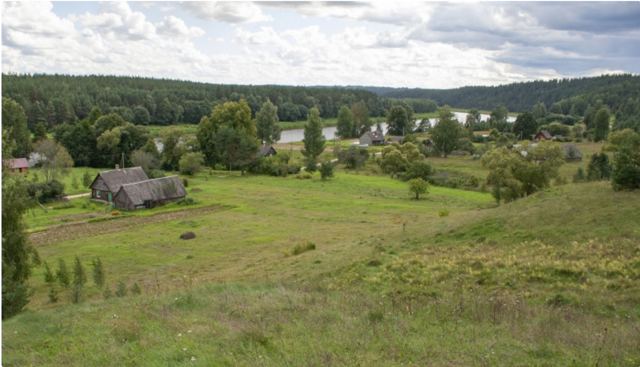
Aizsargājamo ainavu apvidus AUGŠDAUGAVA. Slutišķu sādža. Foto: Andris Soms. DAP

Aizsardzības kategorija: aizsargājamo ainavu apvidus, Natura 2000 teritorija (ietilpst: dabas parks Daugavas loki , ģeoloģiskie veidojumi – Adamovas krauja, Daugavas vārti (Slutišķu un Ververu krauja), Mālkalnes avots, Sandarišķu karengravas, Sproģu gravas, Viļušu avots, dendroloģiskie stādījumi – Hoftenbergas parks, Juzefovas parks, Rozališķu parks).