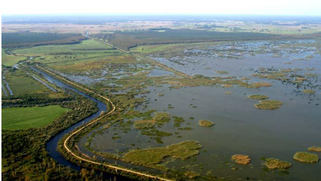
Lubāna ezers.

Latvijas lielākais ezers – Lubāns ir biotopa Dabīgi eitrofi ezeri ar iegrimušo ūdensaugu un peldaugu augāju atradne, kurā sastopami mazlēpe ( Hydrocharis morsus-ranae ), skaujošā glīvene ( Potamogeton perfoliatus ), spožā glīvene ( Potamogeton lucens ), u.c. Lubāna mitrāja kompleksā ietilpst arī daudz aizsargājamu biotopu - upju palieņu pļavas, neskarti augstie purvi, purvaini meži, boreālie (ziemeļu) meži, melnalkšņu staignāji un parkveida pļavas u.c.