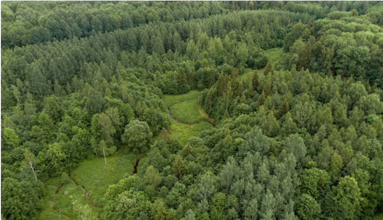
Aizsargājamo ainavu apvidus "Nīcgales meži".

Aizsardzības kategorija: aizsargājamo ainavu apvidus, Natura 2000 teritorija.