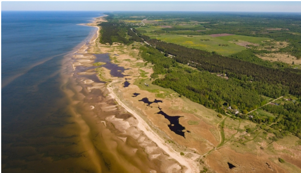
Dabas liegums RANDU PĻAVAS.

Vairāk nekā 40 aizsargājamo augu sugu. Viena no 3 purva mātsaknes atradnēm Latvijā.