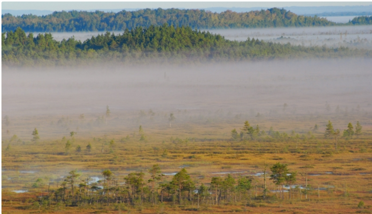
Teiču dabas rezervāts. Purva ainava. Skats no Kristakrūga skatu torņa.

Aizsardzības kategorija: dabas rezervāts kopš 1982. gada, Eiropas Savienības nozīmes putniem nozīmīga vieta Latvijā (PNV) kopš 1994. gada, starptautiskas nozīmes mitrājs (Ramsāres konvencijas vieta) kopš 1995.gada, Natura 2000 teritorija kopš 2004. gada.