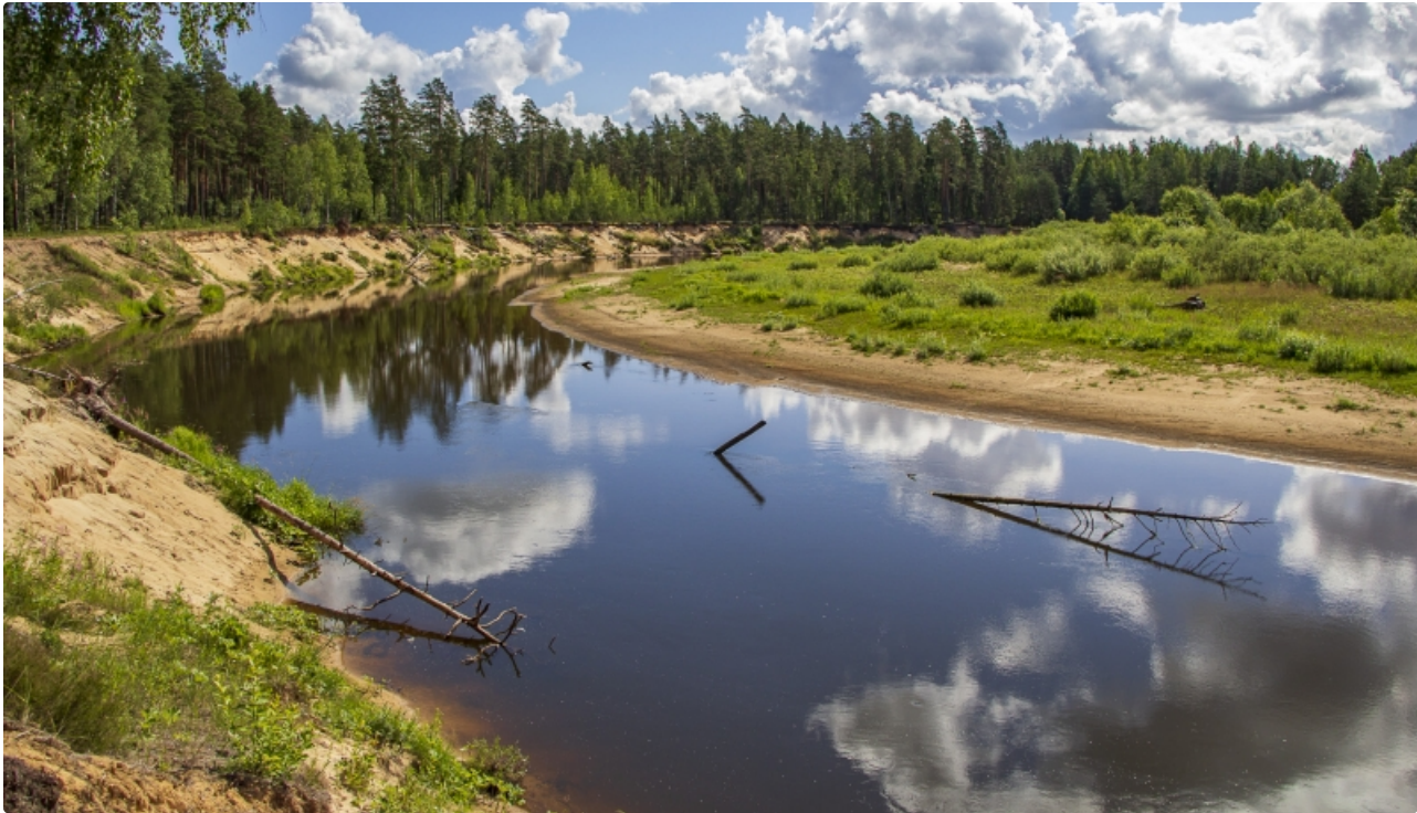
Aizsargājamo ainavu apvidus ZIEMEĻGAUJA. Gauja pie Bekām.

Aizsardzības kategorija: aizsargājamo ainavu apvidus, Natura 2000 teritorija (ietilpst ģeoloģiskie veidojumi – Rāmnieku smilšakmens atsegums, Gaujienas dolomīta atsegums, Jaunžagatu krauja, Žagatu klintis, Randātu klintis un Tilderu krauja, Lejasbindu krauja, Vizlas lejteces atsegumi un Žākļu dižakmens, Sikšņu dolomīta atsegums, dendroloģiskie stādījumi un alejas – Gaujienas „Vārpu” lapegļu aleja, Vidagas lapegļu alejas un stādījumi). Teritorijā iekļauti arī bijušie dabas liegumi – Pirtsliča-Likā atteka , Pukšu purvs un Zemā sala .