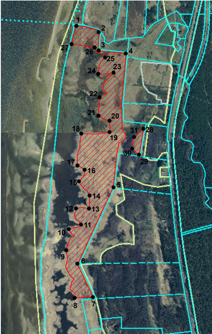
Latvijas koordinātu sistēma LKS-92 Transversālā Merkatora projekcija