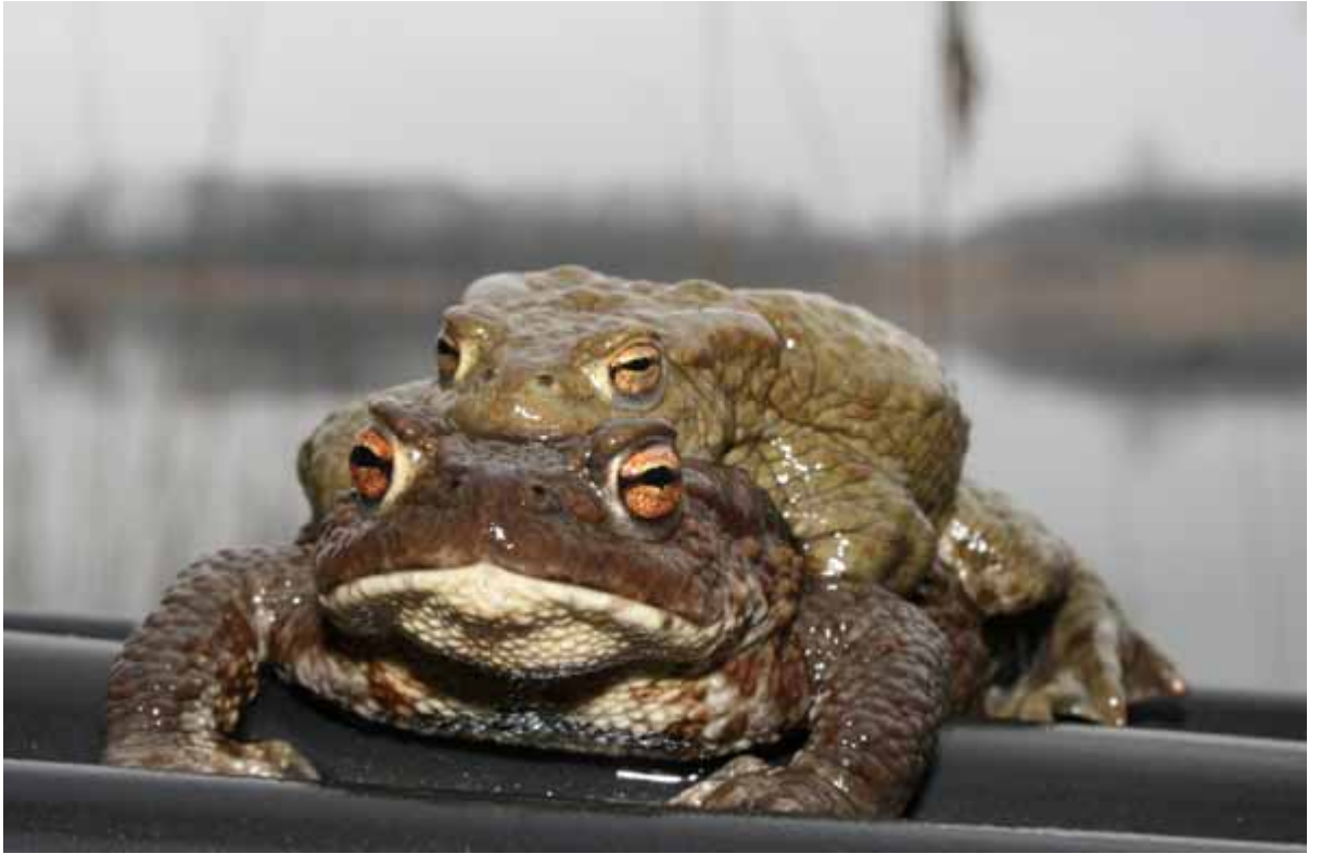
11.attēls. Pavasaris Rāznas nacionālajā parkā.