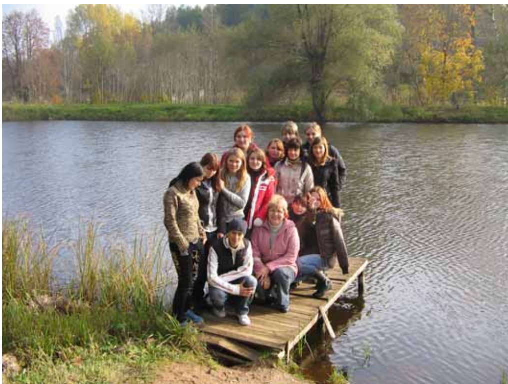
4.attēls. Rēzeknes profesionālās vidusskolas skolēnu grupa ekskursijas laikā.