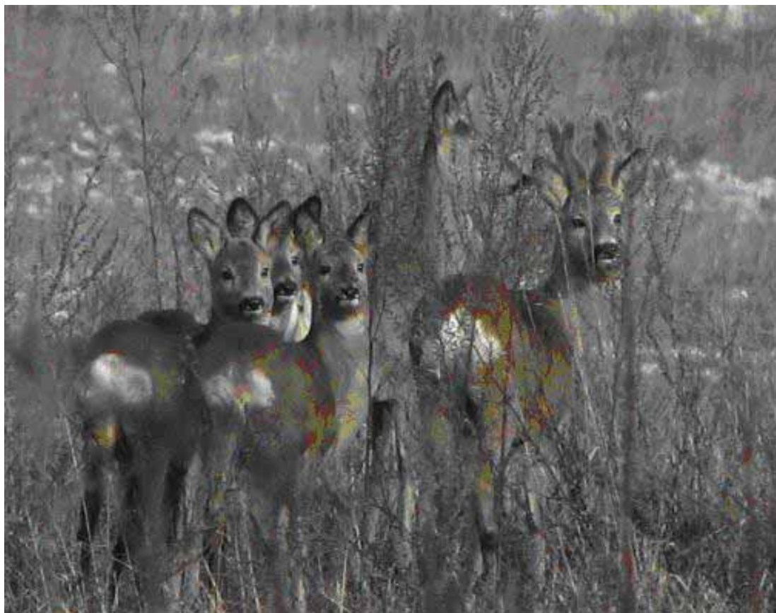
9.attēls. Stirnas Rāznas NP teritorijā.

gan Rēzeknes rajona Kaunatas pagasta teritorijās, bet par to, ka lāči varētu dzīvot pastāvīgi Rāznas nacionālā parka teritorijā, apstiprinājums nav iegūts.