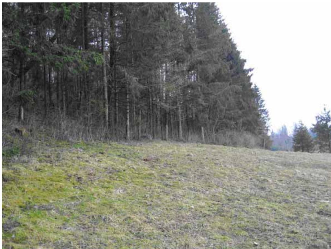
7.attēls. Divu ekosistēmu robeža Krāslavas rajona Ezernieku pagastā.