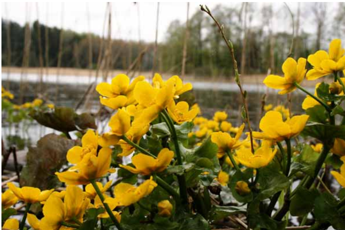
3.attēls. Pie Rāznas ezera.

Lai samazinātu korupcijas risku, veikti iekšējās kontroles pasākumi, tai skaitā izstrādāts un apstiprināts Rāznas NPA reglaments, kārtība par dokumentu un informācijas apriti, darba kārtības noteikumi, pretkorupcijas pasākumu plāns, gada mācību plāns, inventarizācijas sistēma, kārtība, kādā valsts amatpersona rīkojas ar valsts mantu, kārtība, kādā valsts amatpersona ziņo par atrašanos interešu konfliktā, kārtība, kādā tiek piešķirtas piekļuves tiesības iestādes rīcībā esošiem informācijas sistēmas resursiem, personāla atlases kārtība, ētikas kodekss un uzsākta citu iekšējo dokumentu izstrāde.