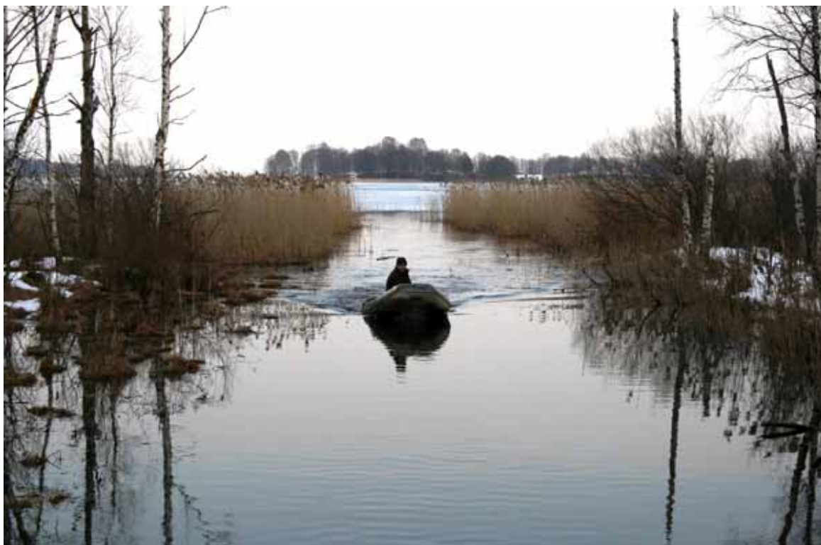
6.attēls. Rāznas NP teritorijā esošo ūdenstilpju kontrole.

Ūdens bioloģisko resursu izmantošanas kontroli Rāznas nacionālā parka ūdenstilpēs 2007.g. veica visi Rāznas NPA inspektori. Zvejas un makšķerēšanas noteikumu ievērošanas kontrole tika uzsākta 2007.gada jūnijā. Tabulā redzams veikto pārbaūžu skaits, kā arī piemērotās sankcijas par normatīvo aktu pārkāpumiem.