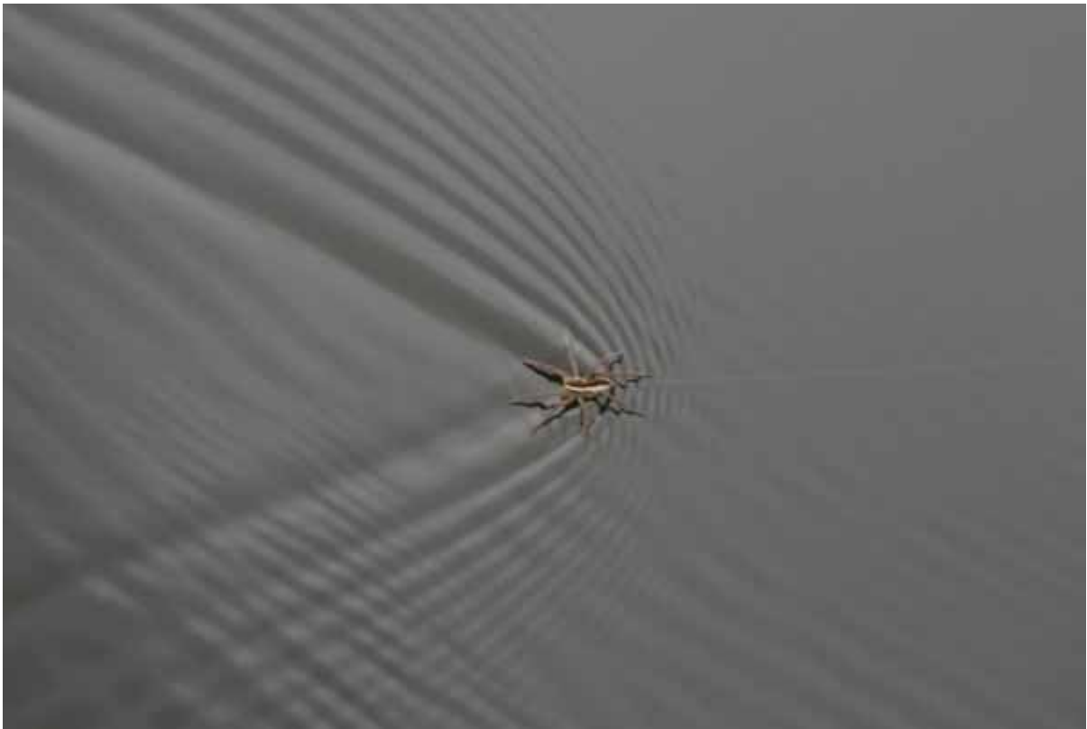
5.attēls. Noskaņa.