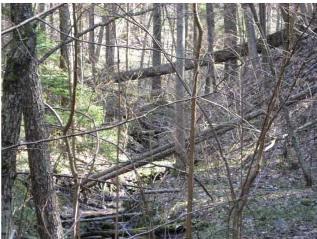
8.attēls. Valsts mežs Rēzeknes rajona Kaunatas pagastā.