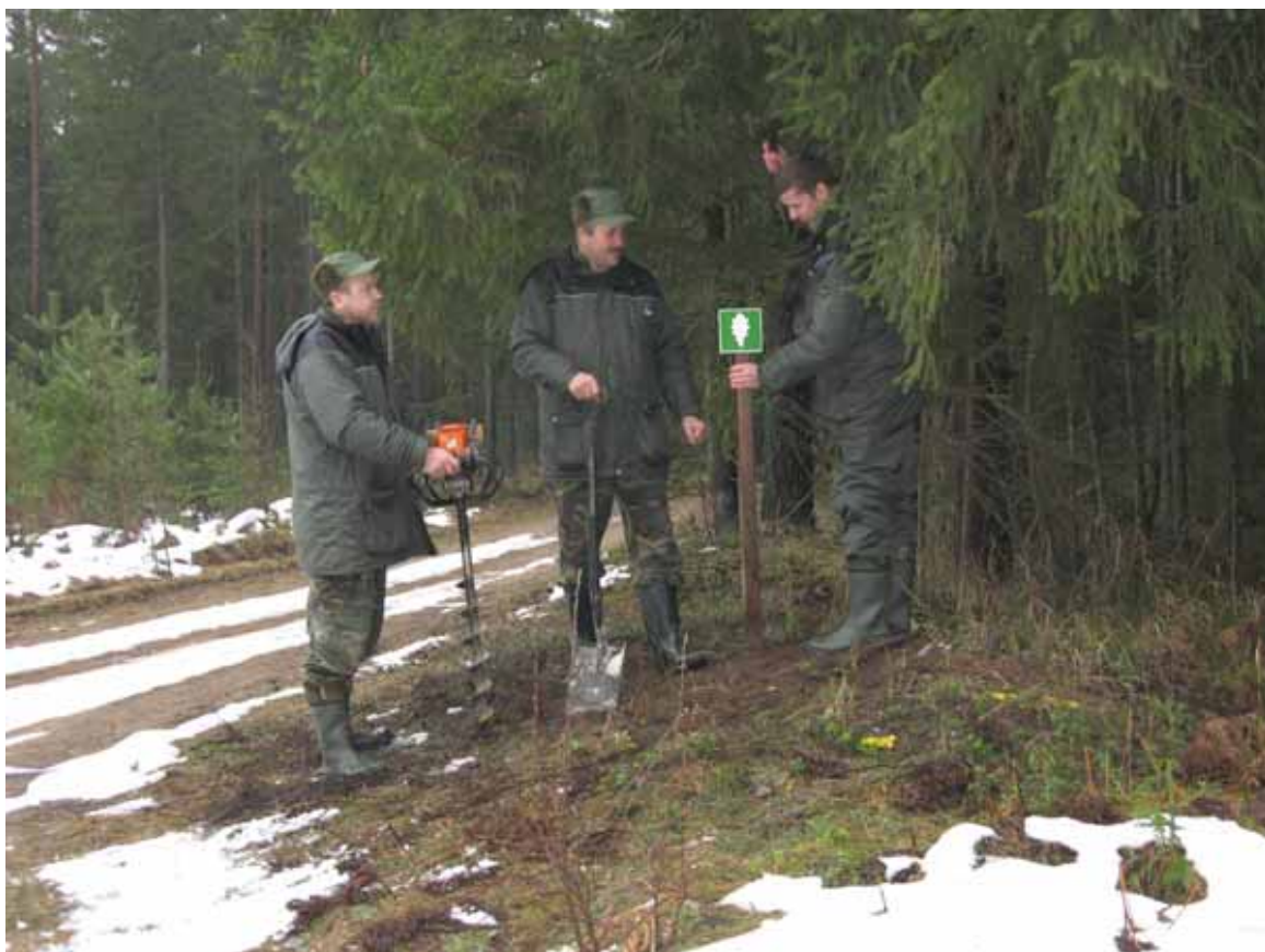
2.attēls. Rāznas nacionālā parka robežzīmju uzstādīšana.