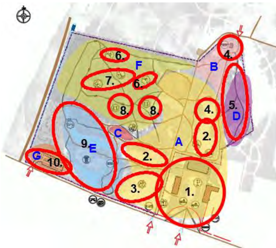
Attēls Nr.2. Parka tematiskās zonas un pasākumu telpas

Papildus jau esošiem ikgadējiem pasākumiem, tai skaitā kultūras pasākumiem, paredzēts paplašināt veselīga dzīvesveida veicinošu, kultūrvēsturiskā un dabas mantojuma izzinošu un izglītojoša rakstura publisku pasākumu klāstu, kas norisināsies, aptverot visu parka teritoriju. Tie ir pasākumi, kas, galvenokārt, ir saistīti ar ikgadējiem gadskārtu svētkiem; veselīga dzīvesveida (sporta) pasākumiem visās sezonās parkā; kultūras pasākumiem kā mākslas plenēriem, izstādēm, festivāliem; organizāciju veidotām ekskursijām, ekspedīcijām, vides pētnieciskiem pasākumiem, kā arī vietējo izglītības un interešu iestāžu rīkoti izglītojošiem pasākumiem.