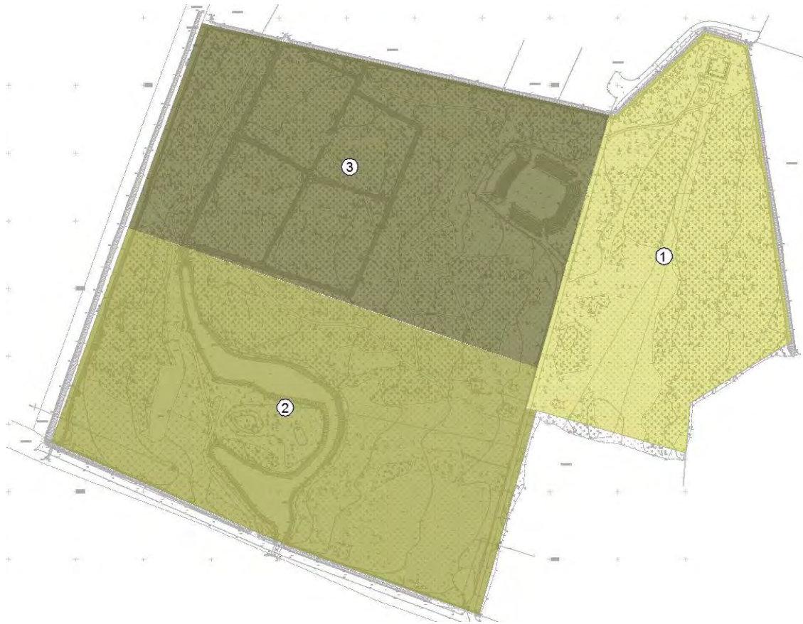
2.att. Elejas muižas parka apsaimniekošanas zonas. 1 – galvenā lauce, intensīvi apsaimniekota teritorija (ainavu parks); 2 – sāna lauce, daļēji intensīvi apsaimniekota teritorija (ainavu parks); 3 – brīvdabas estrādes un mežaparka zona, daļēji intensīvi un ekstensīvi apsaimniekota teritorija

Katrs ainavu veidošanas princips attēlots esošās situācijas fotofiksācijā un modelēts tās nākotnes vēlamā shematiskā vizualizācijā. Fotofiksācijas attēls un vizualizācija papildināta ar skaidrojošu tekstu un ir skatāmi kopā ar konkrētās zonas parka saglabājamo un plānoto kokaugu plāniem, kā arī ar labiekārtojuma un likvidējamo kokaugu plāniem.